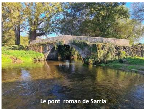
Le pont roman de Sarria

Un deuxième groupe d'élèves, mais de quatrième cette fois, se rendra à Sarria en Espagne, en Galice, du 21 au 27 mars 2026. Sarria étant la dernière ville-étape avant Compostelle, et Roncevaux étant la première ville-étape du périple espagnol du Camino Francès , c'est ce dernier qui sert de fil conducteur à cet échange. Les élèves galiciens viendront à Baigorry du 19 au 24 avril 2026.