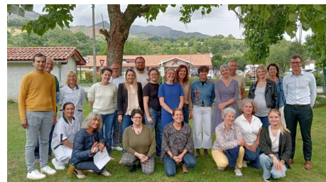
L'équipe du collège 2025, service et pédagogie réunis.

Journal d'information sur les activités du collège à destination des habitants